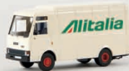
v 34521 Fiat Zeta „Alitalia“