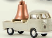
v 32944 VW Pritsche T1b „Glockentransport“, mit Ladegut