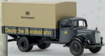
v 40016 MB L 311 „Rollfuhrdienst“