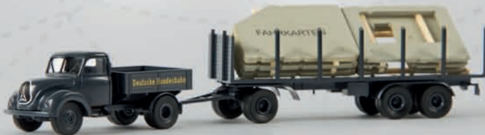
v 42231 Magirus Mercur mit „Behelfs-Fahrkartenschalter“