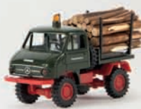
v 39022 Unimog 411 mit Holzladung