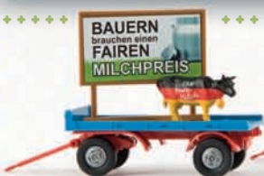
55236 2-Achs-Leichtanhänger mit Werbetafel und Kuh „Die faire Milch“