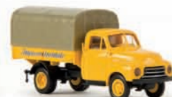
35313 Opel Blitz „Intercontinentale“