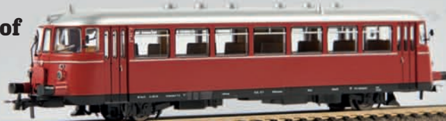
v 64010 MAN Schienenbus VT 26 neutral (DC), TD