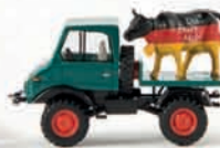
39082 Unimog 421 mit Kuh „Die faire Milch“