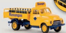
v 35320 Opel Blitz „Kosangas“ mit Ladegut