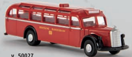
v 50027 MB 0 6600 Reisebus „DB“