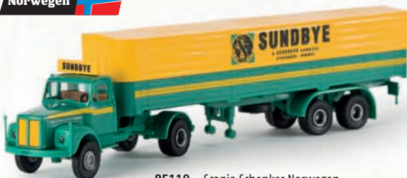
85119 Scania Schenker Norwegen „Sundbye“