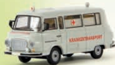
v 30027 Barkas B 1000 Bus „DRK Krankentransport“, TD