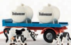
55237 2-Achs-Leichtanhänger mit Tanks und 3 Kühen