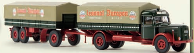
v 86109 Kaelble K 832 L „Lesonal“, TD