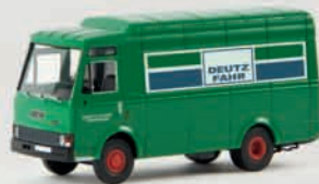
v 34520 Fiat Zeta „Deutz Fahr“