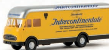
57214 MB LP 322 Möbelwagen „Intercontinentale“