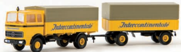
81030 MB LP 1418 „Intercontinentale“