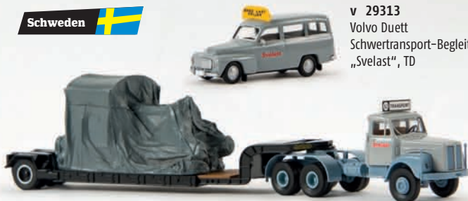
v 85120 Scania Schwertransporter „Svelast“, mit Ladegut