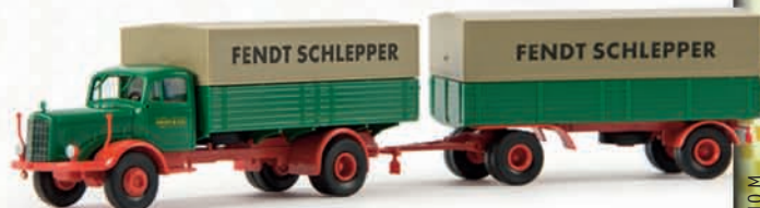
44306 MB L 325 „Fendt“