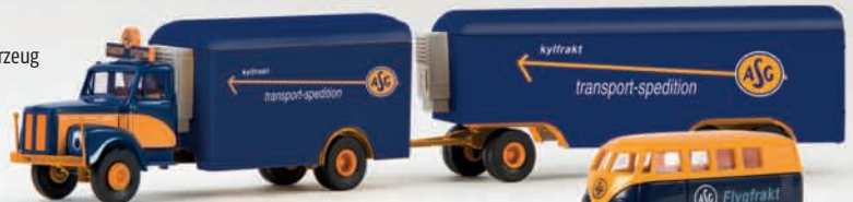
v 85008 Scania L 110 „ASG“