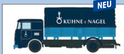
LC 3613 Büssing LU 11 Pritsche-Plane „Kühne & Nagel“