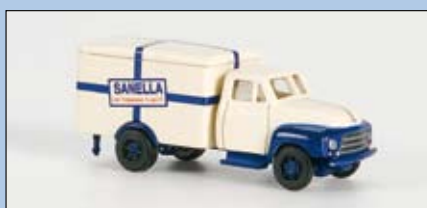
LC 3208 Opel Blitz