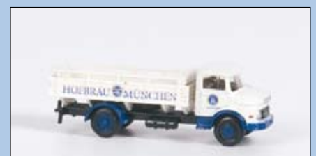
LC 3409 MB L 322