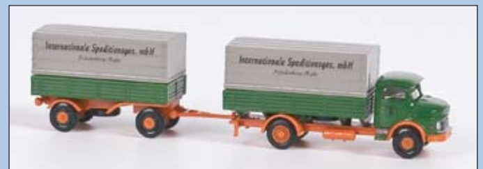
LC 3406 MB L 322

Hängerzug mit Plane „Internationale Speditionsges. mbH“