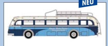
LC 3514 MB O 6600 Reisebus „Rhein-Ruhr-Express“