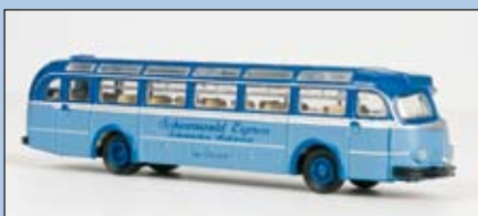
LC 3501 MB O 6600 Reisebus „Schwarzwald Express“ mit Dachfenstern LC 3501B MB O 6600 mit LED-Beleuchtung