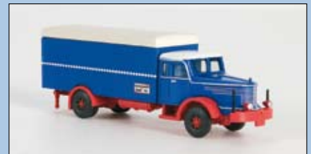
LC 3305 Krupp Titan Kofferaufbau, blau-rot