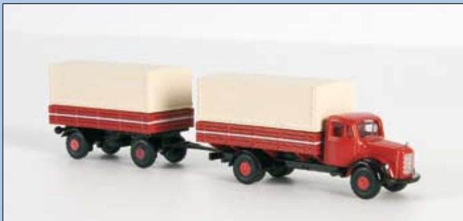
LC 3027 MB L 3500