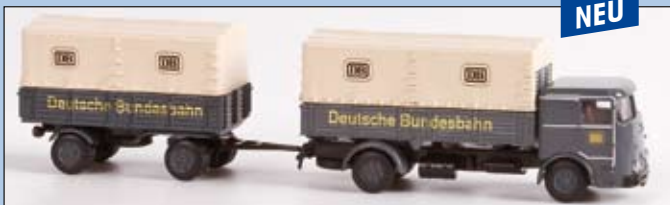
LC 3606 Büssing LU 11 Hängerzug „Deutsche Bundesbahn“