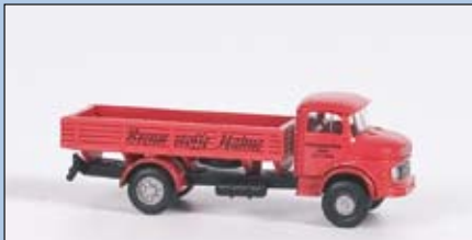
LC 3402 MB L 322