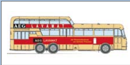
LC 3902 Büssing Aero 1 1/2 Deck Omnibus „AEG“