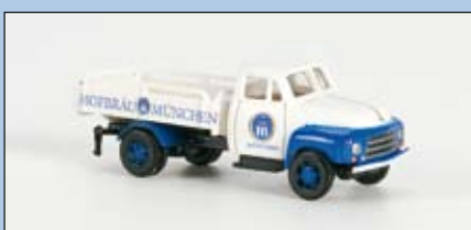
LC 3211 Opel Blitz