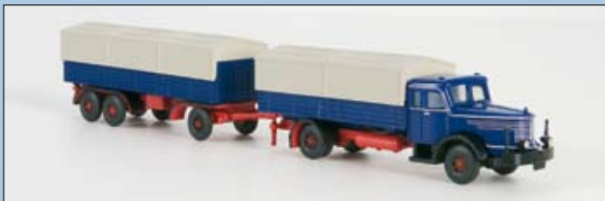
LC 3304 Krupp Titan Hängerzug mit Plane, blau-rot