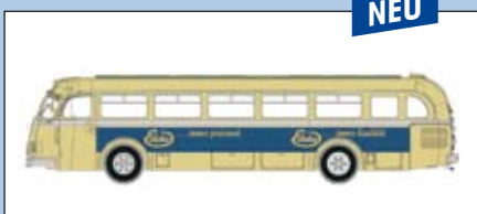
LC 3511 MB O 6600 Stadtbus „Edeka“