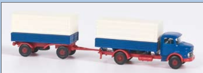
LC 3405 MB L 322