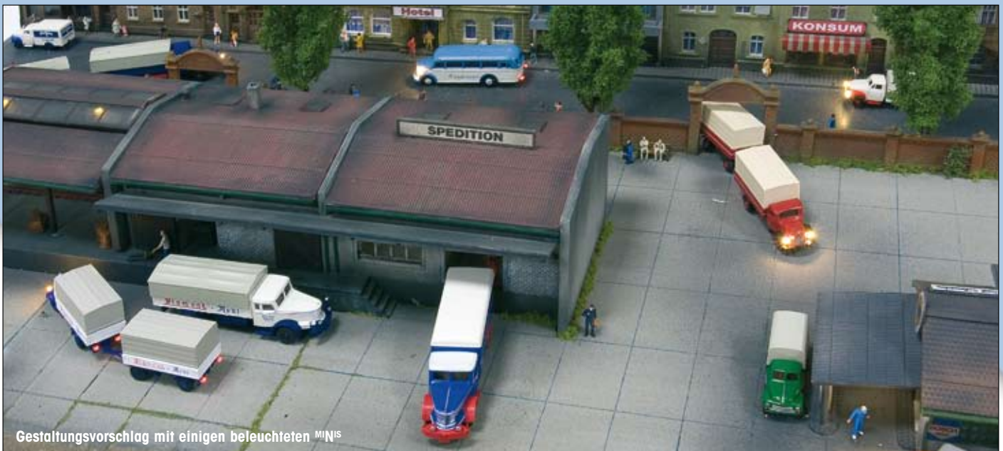
Gestaltungsvorschlag mit einigen beleuchteten MINIS

Alle Abbildungen sind beispielhaft. Modelle können geringfügig abweichen.