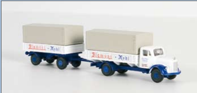
LC 3026 MB L 3500