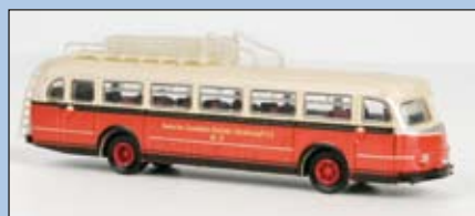
LC 3503 MB O 6600 Omnibus „Deutsche-Eisenbahn-Betriebsgesellschaft A.G.“ LC 3503B MB O 6600 mit LED-Beleuchtung