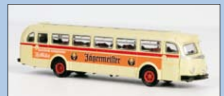
LC 3506 MB O 6600 Stadtbus Rheinbahn/Jägermeister LC 3506B MB O 6600 mit LED-Beleuchtung