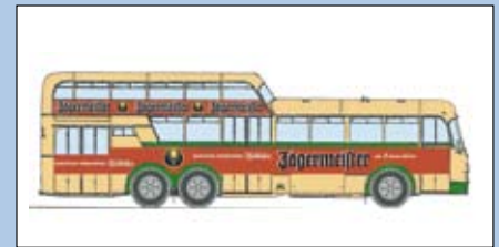
LC 3901 Büssing Aero 1 1/2 Deck Omnibus „Jägermeister“

sondern auch Büssing Omnibusse waren in der Zeit als Reise- und Linienbusse stark vertreten. Um dem gestiegenen Personenaufkommen Rechnung zu tragen, stellte Büssing 1961 in Zusammenarbeit mit der Karosseriefabrik Ludewig den modernen Aero 1 1/2 Deck-Großraumbus vor. Zahlreiche Städte und Gemeinden setzten die Busse im Liniendienst ein.