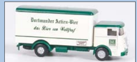
LC 3603 Büssing LU 11 Kofferaufbau „Dortmunder Actien Bier“