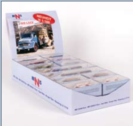
LC 3400 MB L 322