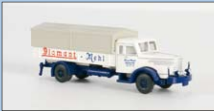
LC 3302 Krupp Titan Pritsche-Plane „Diamant-Mehl“

schnell etabliert. Der Titan wurde u.a. als Sattelzug-, Pritschen-, Kipper-, Koffer- und Busversion betrieben.