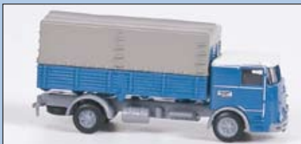
LC 3601 Büssing LU 11 Pritsche-Plane, grau-blau

sechziger Jahre unter der Bezeichnung „Commodore“ weitergeführt.