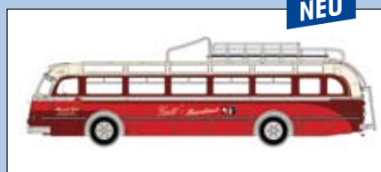
LC 3513 MB O 6600 Reisebus „Gutt's Reisedienst“