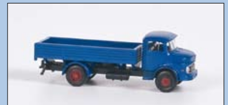
LC 3401 MB L 322