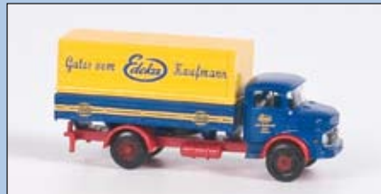
LC 3403 MB L 322