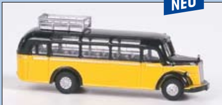
LC 3115 MB O 3500 Reisebus mit Dachfenstern