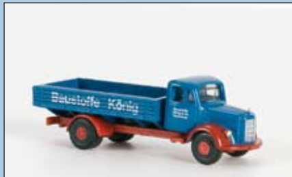
LC 3023 MB L 3500

Die leichten Mercedes-Benz-Haubenlaster der 50er-Jahre. Durch die kriegsbedingte Bereinigung der Lkw-Typen auf nur noch wenige Modelle wurde die Daimler-Benz AG gezwungen, im Bereich der wichtigen 3-Tonnen-Nutzlast-Klasse den Lastwagen Opel Blitz des seinerzeit größten Konkurrenten, der Adam Opel AG, nachzubauen.