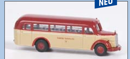
LC 3117 MB O 3500 Stadtbus „Krefelder Verkehrs AG“