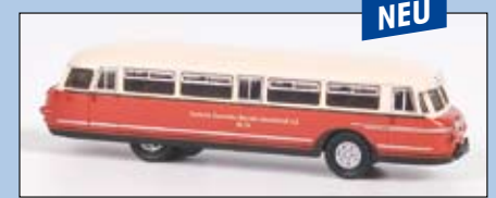
LC 3702 NWF BS 300 „Deutsche-Eisenbahn-Betriebs-Gesellschaft A.G.“

windschnittigem Bug. Es gab je nach Ausstattung bis zu 45 Sitzplätze und bis zu 100 Personen konnten bei maximaler Auslastung der Stadtbusse befördert werden.