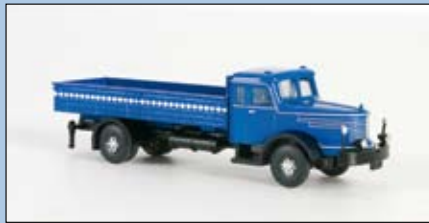
LC 3303 Krupp Titan Pritsche, blau-schwarz