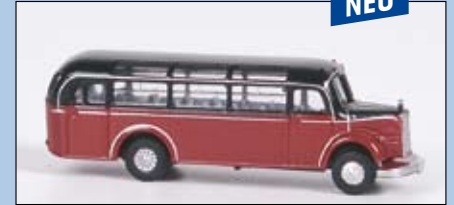
LC 3114 MB O 3500 Reisebus mit Dachfenstern