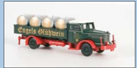
LC 3310 Krupp Titan Engels Glühwein für den Weihnachtsmarkt