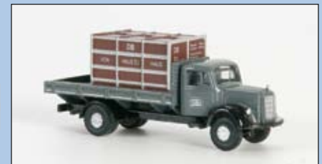
LC 3030 MB L 3500

Sonderaufbau Container „Von Haus zu Haus“