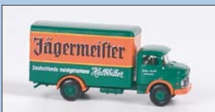
LC 3407 MB L 322

Hängerzug mit Plane „Internationale Speditionsges. mbH“