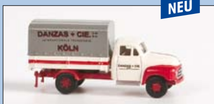
LC 3216 Opel Blitz