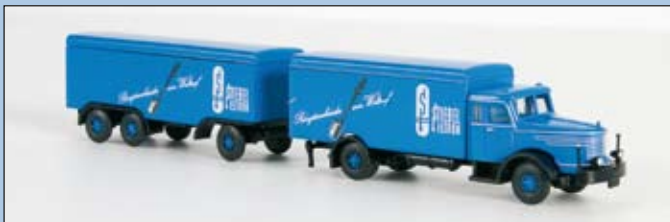
LC 3311 Krupp Titan Hängerzug mit Kofferaufbau „Stiebel Eltron“