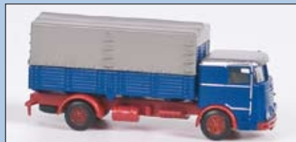
LC 3602 Büssing LU 11 Pritsche-Plane, blau-rot