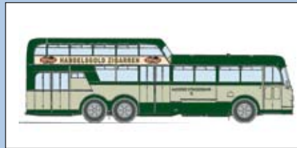
LC 3903 Büssing Aero 1 1/2 Deck Omnibus „Handelsgold Zigarren“ Aachen