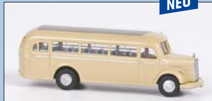
LC 3116 MB O 3500 Stadtbus neutral