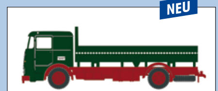
LC 3614 Büssing LU 11 Pritsche grün-rot