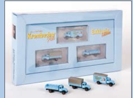
LC 3035 MB L 3500 3er-Set