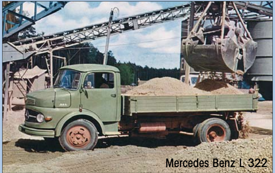
Mercedes Benz L 322

Der klassische auf den Rahmen aufgesetzte Kühler zierte die Mercedes Benz LKW seit Anfang des 20. Jh. Es war also eine kleine Revolution als 1958 die komplett neugestylte Kurzhauben-Baureihe die Fachwelt überrascht. Ein breiter Kühlergrill im Stil der SL Personenwagen und eine über die ganze Breite gezogene Haube kennzeichnen den neuen 6-Tonner L 322 mit 110 PS.