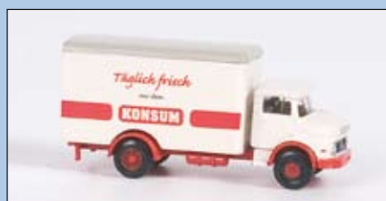
LC 3408 MB L 322