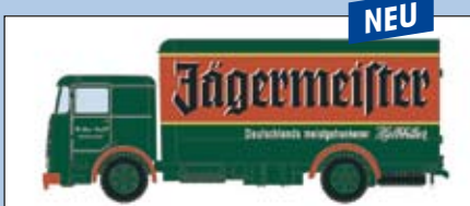
LC 3612 Büssing LU 11 Koffer „Jägermeister“

Inhalt: je 4x LC 3610, LC 3611, LC 3612, LC 3613, LC 3614