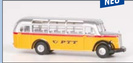
LC 3113 MB O 3500 Reisebus „PTT“ mit Dachfenstern