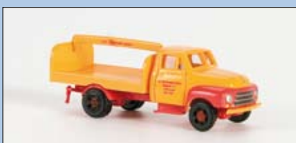
LC 3207 Opel Blitz

densten Aufbauten, je nach Anforderung des Kunden ausgestattet.