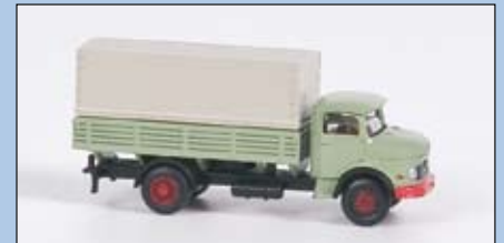
LC 3404 MB L 322