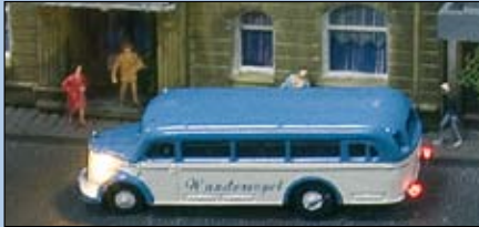
LC 3107B MB O 3500 Omnibus „Wandervogel“, mit LED-Beleuchtung

wurden von 1950-55 produziert. Restaurierte Exemplare fahren noch heute.