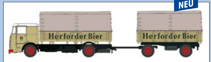
LC 3610 Büssing LU 11 Hängerzug „Herforder Bier“